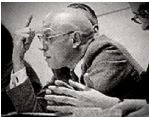
Michel Foucault

Manchmal ist es schwierig zwischen der Corona-Realität 2020 und der dystopischen Vision zu unterscheiden. Ist der folgende Satz einer der Zeh'schen Fiktion oder einer der Drosten & Co Realität?: „Wenn wir aufhören, gemeinsam an Sicherheit und Sauberkeit zu arbeiten, gibt es binnen weniger Wochen eine [neue, zweite] Epidemie.“